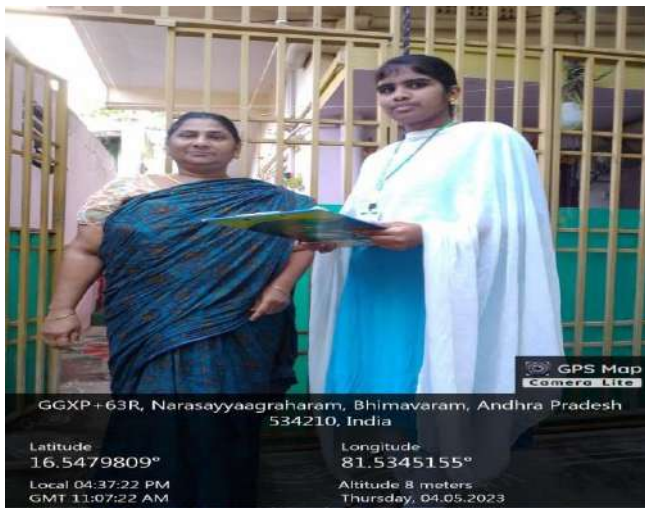
GPS Map Camera GGXP+63R, Nerasayyaagraharam, Bhimavaram, Andhra Pradesh 534210, India Latitude 16.5479809° Longitude 81.5345155° Local 04:37:22 PM Altitude 8 meters GMT 11:07:22 AM Thursday, 04.05.2023