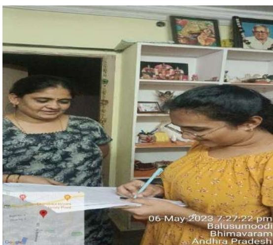
06-May-2023 7:27:22 pm Balusumoodi Bhimavaram Andhra Pradesh