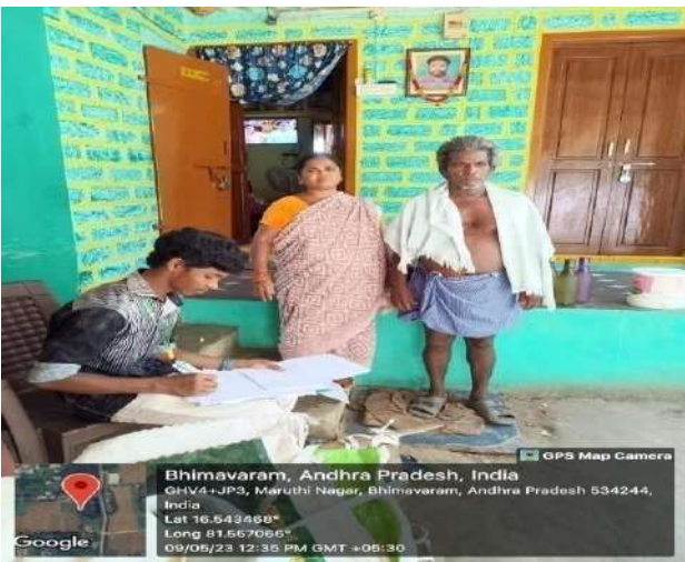
GPS Map Camera Bhimavaram, Andhra Pradesh, India GHV4+JPS, Maruthi Nagar, Bhimavaram, Andhra Pradesh 534244, India Lat 16.543658° Long 81.667066° 09/05/23 12:35 PM GMT +05:30