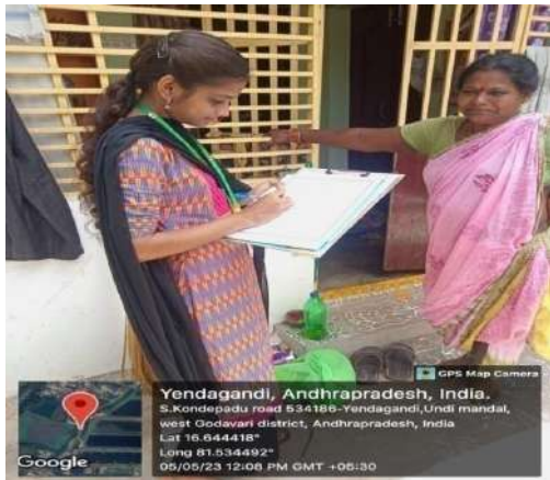
GPS Map Camera Yendagandi, Andhrapradesh, India. S.Kondepadu road 534186-Yendagandi,Undi mandal, West Godavari district, Andhrapradesh, India Lat 16.844418° Long 81.534492° 09/05/23 12:06 PM GMT +05:30