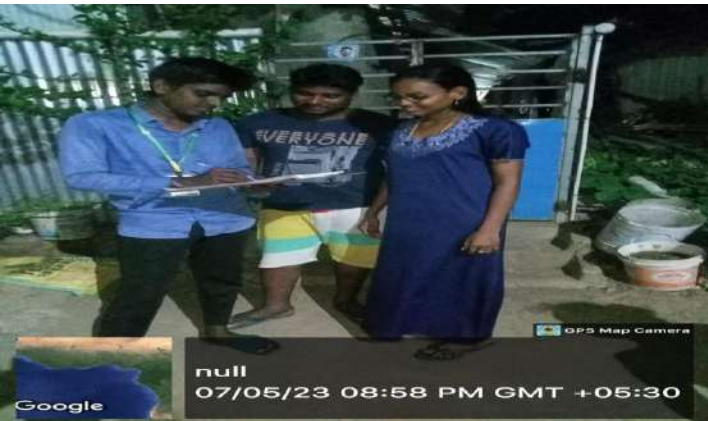
GPS Map Camera null 07/05/23 08:58 PM GMT +05:30