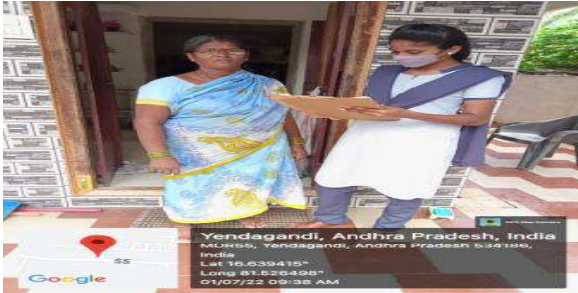
Awareness campaign – Safe drinking water, Organic farming ,Save soil, Consumer rights, Govt. Schemes for Un employed , women Safety, online Payments etc.,