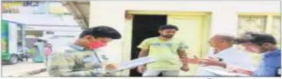
భీమవరంలో సర్వే చేస్తున్న ఆర్ఆర్డీఎస్ ప్రభుత్వకళాశాల విద్యార్థులు