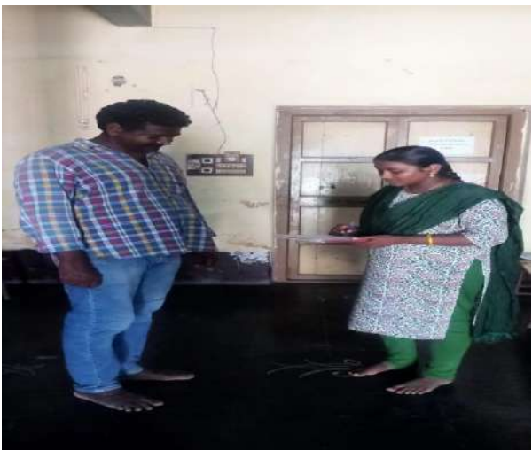
GPS Map Camera null 07/05/23 08:58 PM GMT +05:30