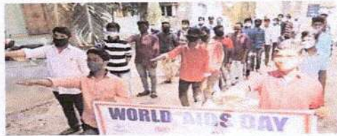
నిడదవోలు ప్రభుత్వ జూనియర్ కళాశాలలో ప్రతిజ్ఞ

విశాలాంధ్ర - కొయ్యలగూడెం : ప్రాథమిక ఆరోగ్య కేంద్ర ఇలాంటి అసుపత్రి నుంచి సుదాన సెంటర్ వరకు రాల్చి