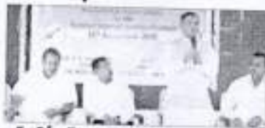
ఆర్ఆర్డీఎస్ కళాశాలలో ముఖ్యమంత్రి మాజీ ఎంపీ నారాయణస్వామి

దీనివరకు కార్మికులకు ఉపాధి అవకాశాలు, కాస్తానికే అదాయం తెచ్చిపెడుతున్న అర్కా రు గాన్వి అభివృద్ధి చేసుకుంటూనే ప్రకృతివనరులను కాపాడుకోవాల్సిన అవసరం ఉందని చలువూరు పక్షం పేర్కొన్నాయి. దీనివరకు ఆర్ఆర్డీఎస్ ప్రభుత్వ ద్వారా కళాశాలలో శినివారం మూర్తిరాయ కరణయంతి ఉత్సవాల్లో భాగంగా నిర్వహించిన కార్యక్రమంలో ఆంధ్రప్రదేశ్ లో సుద్ధి అర్కా అభివృద్ధి అనే అంశంపై మాజీ ఎంపీ యల్లా నారాయణస్వామి, నాగార్జున యోగువర్మిణి ప్రాసెసర్